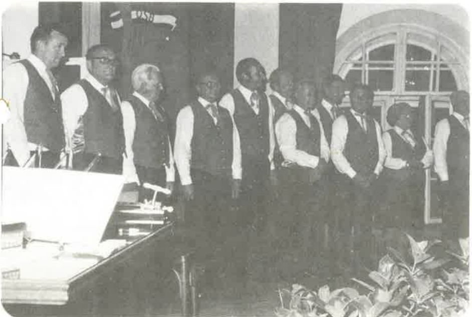
Ehrung der Sänger für 25 jährige aktive Mitgliedschaft

PS.: Dieser Bericht, ist als geschichtliche Dokumentation für jeden Obertrumer Bürger gedacht.