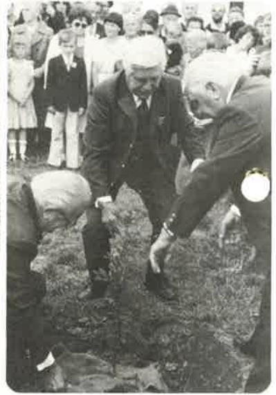
Pflanzung des „Kronprinzen“