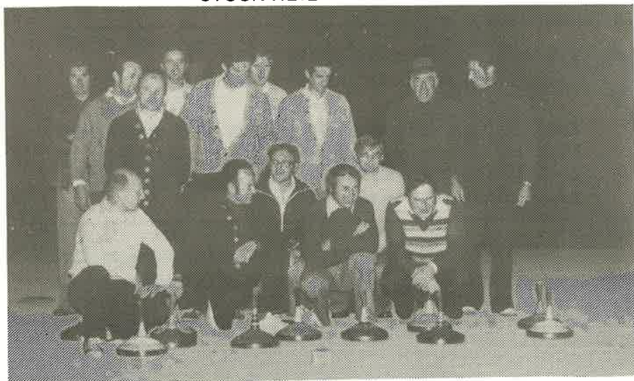
Die Eisschützen beim Training