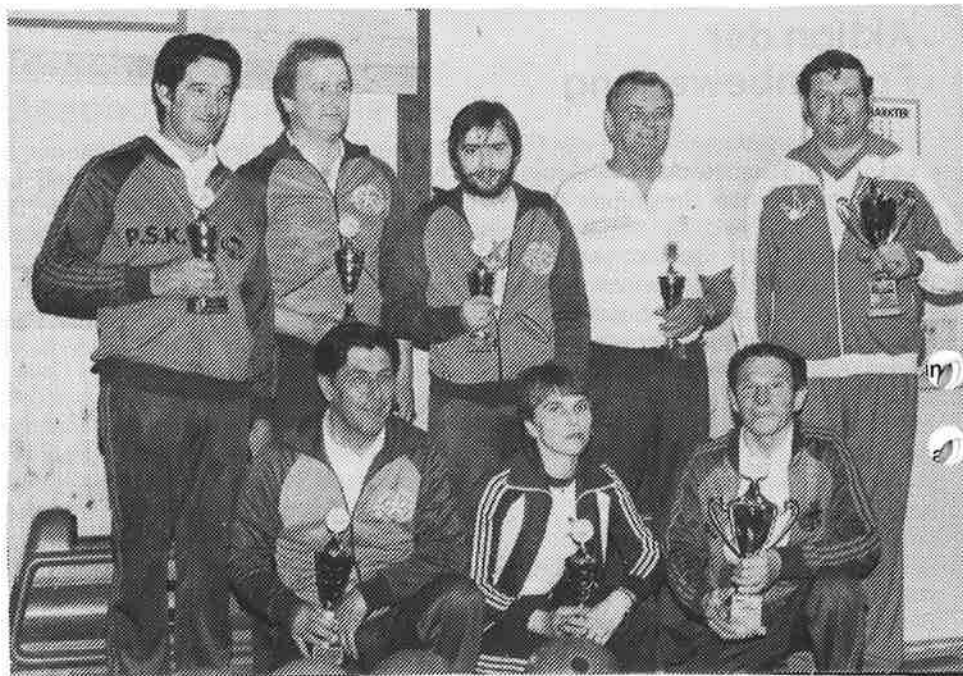
1. Betriebssportkegler-Landesmeisterschaften im Einzelbewerb: