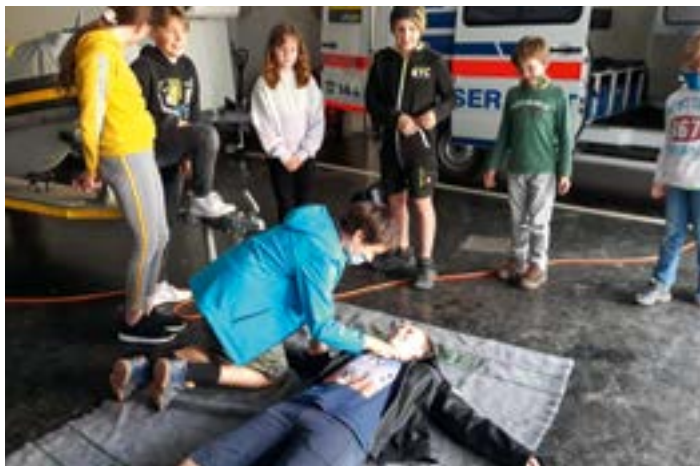
Grundkenntnisse der Ersten Hilfe auffrischen

In weiterer Folge veranlasste uns das kühle Wetter unsere Aktivitäten vermehrt Indoor auszuüben. Das nützten wir, um uns auf die Badesaison akribisch vorzubereiten. Die Grundkenntnisse der Ersten Hilfe, die Baderegeln sowie die Möglichkeiten zur Rettung eines Verunglückten im Wasser konnten so jeweils einen Nachmittag lang, spielerisch in Gruppenarbeiten, aufgefrischt und gefestigt werden.