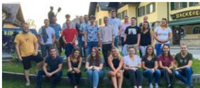
Vor dem TRUMER Sommerkino 2020