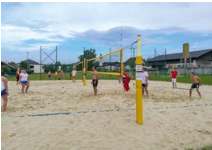
Volleyball Sommer 2020