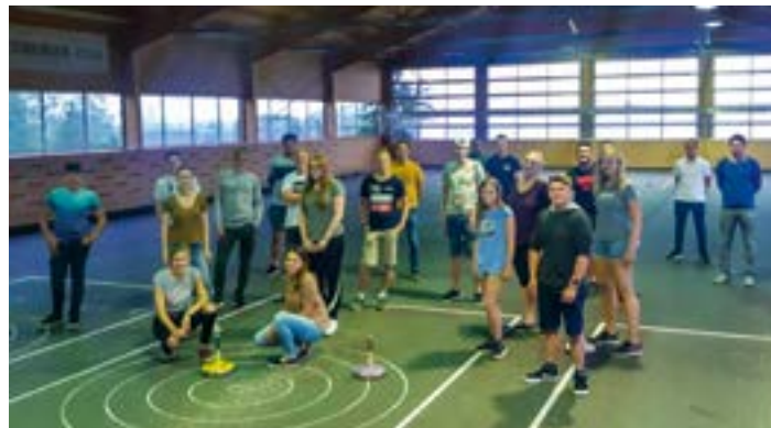
Stockschießen beim Wieserwirt Sommer 2020