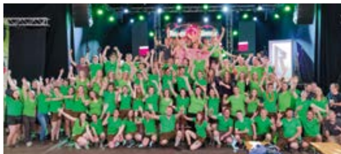
JVP Obertrum am TRUMER BIERFEST 2019