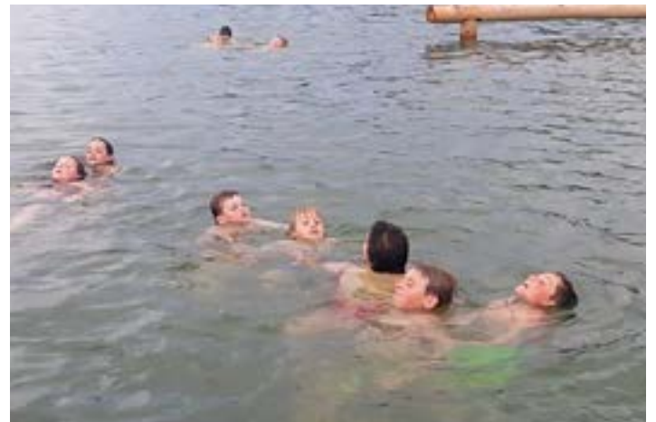
Retten im Wasser